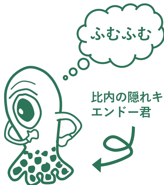
比内の隠れキャラ： エンドー君