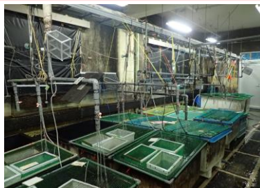
実験場内に泉が湧いており新鮮な水でサケ・マスを飼育できます