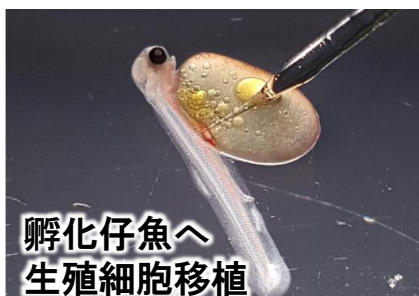
孵化仔魚へ生殖細胞移植