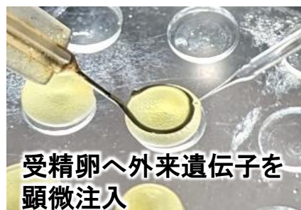
受精卵へ外来遺伝子を顕微注入